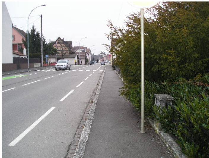
Végétaux à tailler.